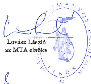
Lovász László az MTA elnöke

Az intézmény 2018. évi költségvetését jóváhagyom: