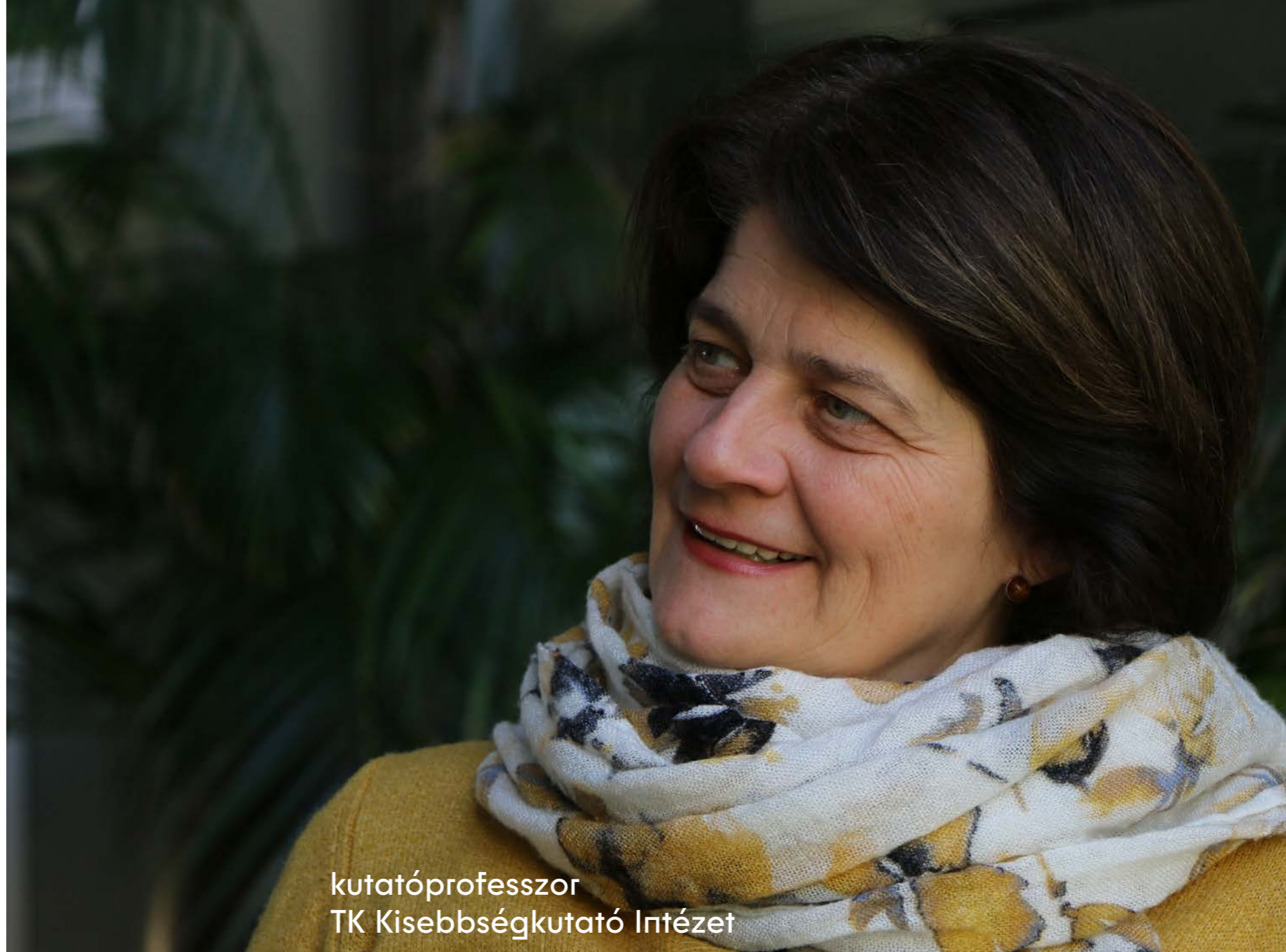
kutatóprofesszor TK Kisebbségkutató Intézet

Ez az a depolitizálás, amelyről a szakirodalom beszél, sok esetben azonban a depolitizálásnak egy sajátos esete, amelyben a politika mentális, fenomenológiai értelemben jelen van ugyan, de a félelem miatt, hogy egy kriminalizált környezetben tönkreteljen a cselekvés és együttműködés lehetőségét, távol tartják a beszédet, a cselekvés közös értelmezésétől.