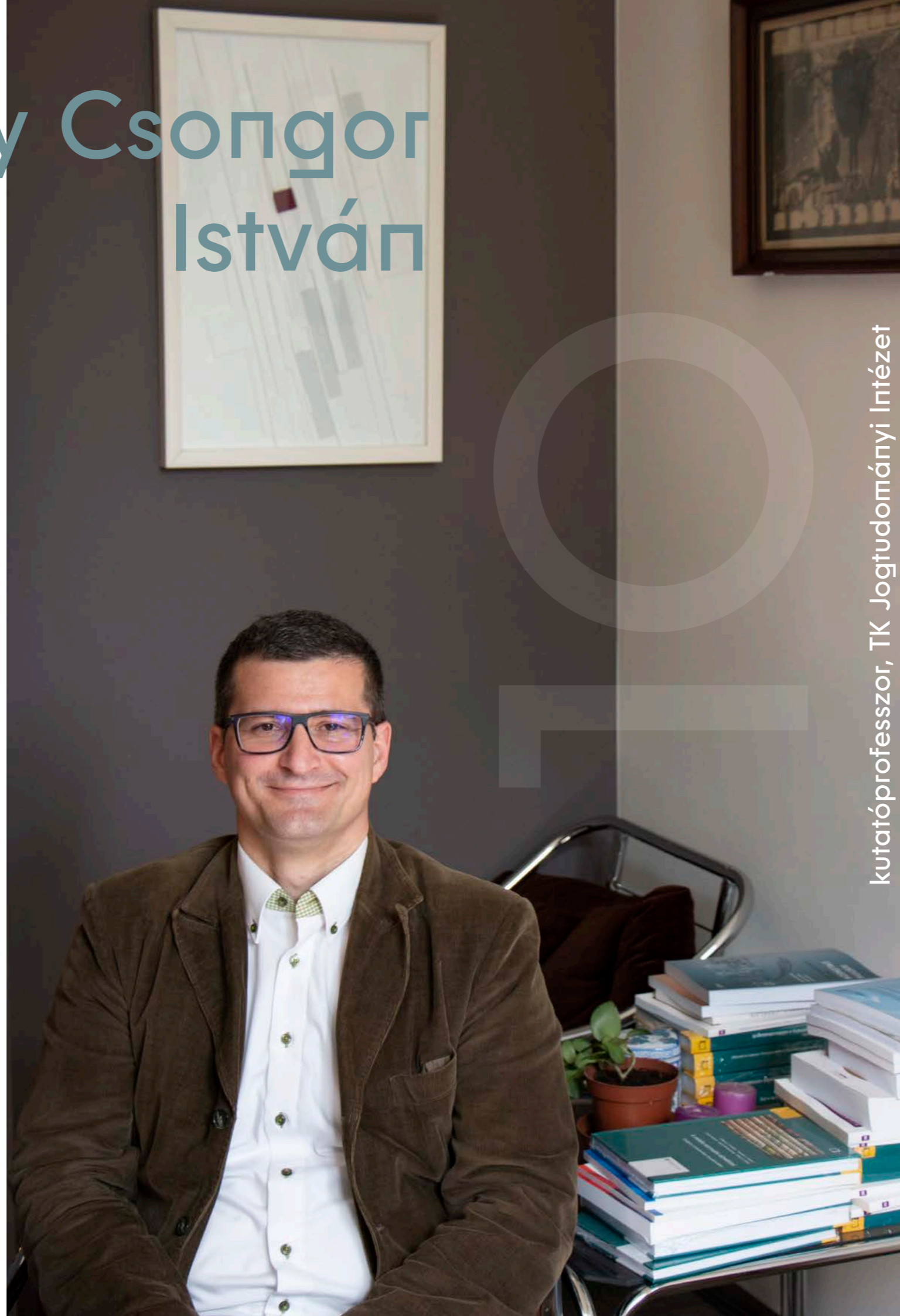
kutatóprofesszor, TK Jogtudományi Intézet

Ezen kívül még megemlíteném a tudományos pályám egy, a jelenlegi akadémiai standardok által kevésbé figyelembe vett, azonban szívemhez közel álló eredményét. Az angol nyelv dominanciája mellett a publikációs tevékenységemben sikerült megvalósítani a többnyelvűséget. Tudatosan figyeltem arra, hogy az angol és a magyar nyelvű publikációs tevékenységem ne váljon kizárólagossá, és ugyanúgy publikáljak magasan jegyzett francia, német és román szaklapokban is (például Cahiers de l'arbitrage, Dreptul, IPRAX, Neue Zeitschrift für Kartellrecht, Osteuropa-Recht, Revista Română de Drept al Afacerilor, Revista Română de Drept European, Revue de Droit International et de Droit Comparé, Revue Internationale de Droit Comparé, Wirtschaft und Wettbewerb, Zeitschrift für ausländisches öffentliches Recht und Völkerrecht, Zeitschrift für Europarecht, Internationales Privatrecht und Rechtsvergleichung, Zeitschrift für das Privatrecht der Europäischen Union).